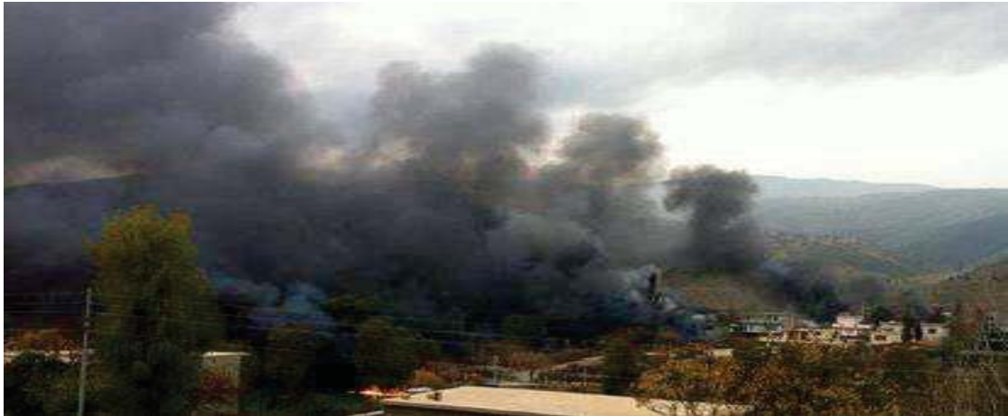
سەرچاوه: فەرھاد محمد، وەرگەرانی تەنكەرێك پووداویكى ھاتووچۆی لێدەكەوتیته وه،

http://www.awene.com/article/2014/01/15/29016