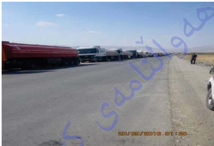
پێگای مه‌رزی نیوده‌وله‌تی باشماخ