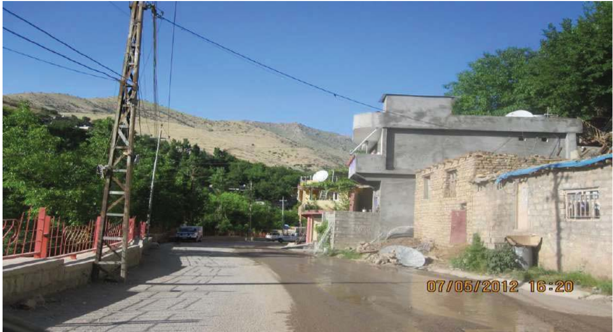
سه رچاوه: فۆتۆی توپزه ره کاتی هه لسان به کئومالی کردنی رینگای بیاره-ته ویله.