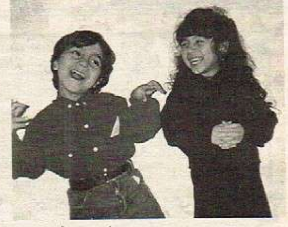
کریف - یاد هیوا سرهنگ - هولندا