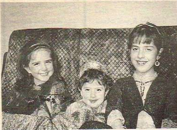
شمن - کانی - کهنار ناری دین