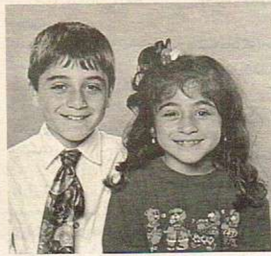
پهيام - پایان - هولندا