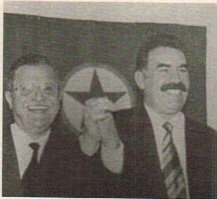
کسوکاری په کیان کوشتموه. توانای کوتای تم جنگه هییه.

* جندگی نیوان خزان و پدک، له مایسی 1994 داده سینیکرد، چون ده پوهستیئن؟ پنشمه مرگه گان گسروکاری په کترین کوشتموه ههروجا گاره گانی پنشمه مرگه ناخرینه ژیر کیتفوه. له گویندا کوتای دیت؟ - وهک ده زانیت زور ناسانه. له 1965، 1966 و 1978 پدک سدان کادیری کوشتن له کاتیکیا به ههکاریدا تیده پیرن بۆ توريكیا. پاشان توانسان ریکیموین: ناگر بیستین و شپ بۆ 8 سال راگرتین. * گوتم: بهلام تمه تانیا ساری پی. - دای تاپتم. له تانیت کوتای پی بهنیرت. پروا ناکم هه میسه بهردوام بیت له مر نموه