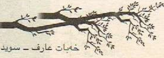
خه بات عارف - سوید