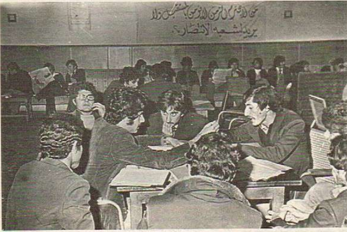
خویندکارانی زانکۆی سلیمانی (1979) تەنانت لە ژێر درووشمی بەعیشدا خویندگەشتن تاوانبار دەکەن.

دەستەدەگشتی، سەلبەھی شاعیری، بەھری ھونەری و ھیزی داھینانی ھەر شاعیریک لەو دەبە، تاجەند دەتوانم بەو پەوێندەبە پشەوی شاعیری بە خەلکەو بەستۆتو ناشنامان بکات شاعیر تاج ئەندازەبەک دەتوانت پەوێندی تەسەوای تێوان مەرۆف و سەرۆت بەرجەستە بکات. چۆن و لە چ ناستیکیا سەرۆشی تاکە کەسی نەوێنە، ھەلسۆکووتی، چارەووسی ئایدیای دەخاتە قالبیکی ھونەرییەو؟ بە چ شۆبەبەک وینە زەمان و زەمینیکی دیارکرومان دەخاتە بەردەست؟