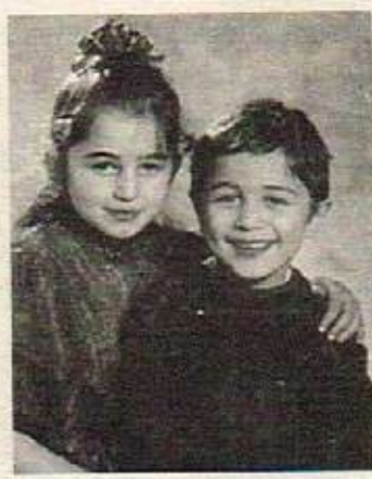
نازیلا - نازاد رهحمان - سهقر