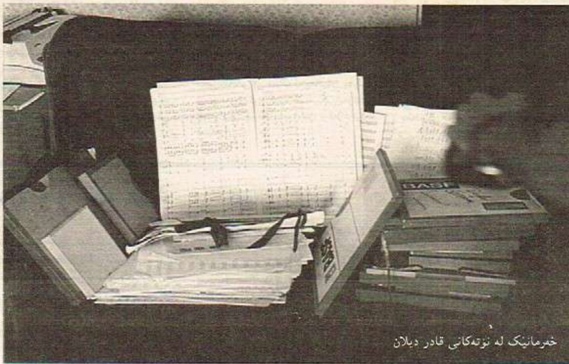
خهرمانیک له نوتهکاتی قادر دیلان

لهو کاتمی که له سلیمانی بووم ههسور ناهنگه کاتمان بز کاری خزمت به کومدلی بووه، بز پاره نیبووه. کاری نیمه چونه ناو خهلهکوه بوو تا فینریان بکمن چون موسیقاییان خوش بوویت و چون گوی له موسیقا بگرن.