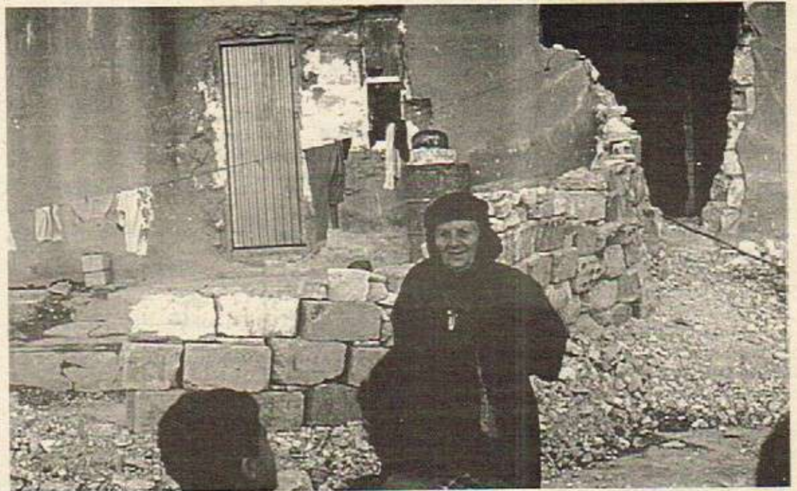
دایرەری رەش پۆش، منداڵەکانی لەم زیندانەدا لەبێناوی کوردستانیکی نازاددا لەدەستدا، نیستا لە زیندانیکێ نازاددا دەژی.