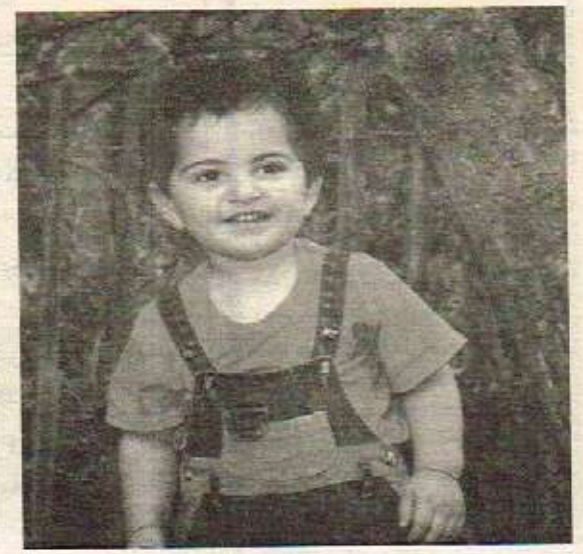
رهنو ناسو - لهندن