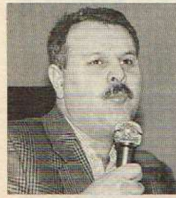
سالاز حه‌مه ره‌شید: کارێکی چاک نییه مهلبند بکرتته جیگی ململانێی حیزبه‌کان. هه‌ول بدریت ههلبژاردنیکی دیموکراتیانه بکرتت.

ئیداره‌ی مهلبندا داده‌مه‌زێنتی به‌ بێ بوونی ئەم په‌یوه‌ندی مهلبند که‌شه‌ ناگات. ۵- په‌یوه‌ندی له‌گه‌ل هه‌موو سه‌نه‌ره‌کانی تری کۆمه‌لگای کوردی ئەم وڵاته‌ ده‌به‌سه‌نیت و په‌ره‌ی پتی ده‌دات. هه‌ول ده‌دات به‌یه‌که‌وه چوارچێوه‌ی ستراتیجی هاو‌به‌ش بۆ کاره‌کانیان دا‌به‌رێژن. ۶- په‌یوه‌ندی به‌ خه‌لکانی شارمزا و لێهاتوو، زانیان، نوسه‌ران، هونه‌رمه‌ندان و روئنبیران بکات تا له‌سه‌رنج و راو بچوونیان ئاگادار بێ؛ پێشنیار و داواکانیان وه‌ربگریت؛ له‌ چوارچێوه‌ی کارنامه‌ی خۆیدا جیگی بۆ بکاته‌وه و له‌ کرده‌وه‌کانیدا ره‌نگ بداته‌وه.