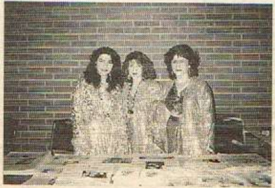
چهند کچیکی کورد سهردانی میزی ژینی نوی دهکهن

ژینی نوی - لهندن له ناههنگی مهلهندی رۆشنیبری کوردیدا نزیکه ۵۰۰ کهس بهشداریان کرد. تا شهوتیکی درهنگ ناههنگی ههله رکت و گۆرانی بهردهوام بوو. چهندین تیبی موسیقا بهشداریان کرد. له دهری هۆله کهش مهلهنده رۆشنیبرییهکان پیشانگای کتیب و بلاوکراویان رازندهوهوه. مهلهندی رۆشنیبری کورد دهرهفتی ژینی نوی بان دایوو له وشهوهدا تا پهوهندی ژۆرتو به کۆمه لگای کوردیهوه بهسهتن. کارگهتانی ژینی نوی میزیکه قهشهنگیان رازندهوهوه. ژماره ههوتی ژینی نوی بۆ شهوی نهورۆز ناماده کرابوو. هه ره وشهوهدا ژینی نوی چهندین پهوهندی نوی ی دامهزاند له کهل کۆمه لگای کوردیدا.