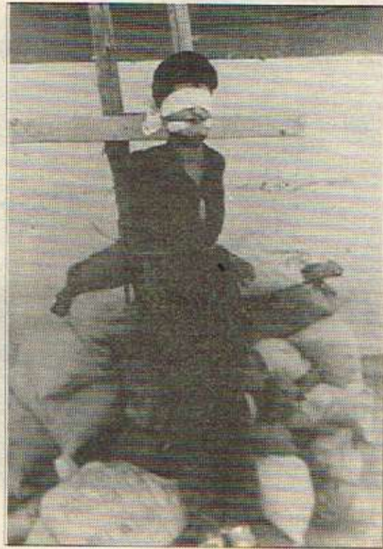
تاوانیکی تری به‌عسیه‌کان

له‌ناو هه‌مسه‌رواندا، بێش و ئێک زیناتر سه‌زنجی راکشام. وه‌ک بووبیته‌ خه‌لۆیه‌کی زۆر زانیان، هه‌منه‌و به‌یانیه‌ک به‌ کیشیان ده‌کرد بۆ لیدان، هه‌سه‌رمه‌پانگی باشیان ده‌کرد و به‌ راکشایشان لاشه‌که‌یه‌یان ده‌که‌رده‌وه‌ به‌ ژوردا. بالابه‌رز و به‌خۆوه‌که‌ی له‌ خۆل و خۆیندا