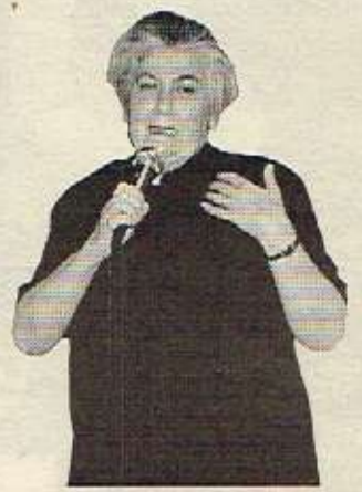
سورهیا مستهفا: کۆمیتتهی پێشوو بـیرووای جووادی خوێبان و کیتشهی کوردستانیان تیکهال به کاری مهلبند نهدهکرد.