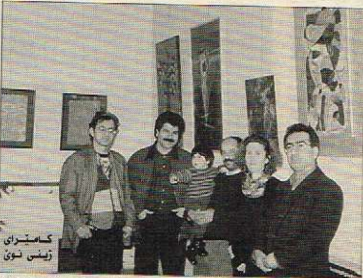
دەستەبەکە لە ھونەرماندانی ئەمڕۆ و یەکیەکی یاشەرۆژ لە پێشانگاگەدا

پروژەیی داھاتوو پێشانگایێکی کە لە لایەن رێکخراو کۆمەڵگا کوردیەکانەوه دەیکەن. ھەر چەندە بۆ پروژەیی داھاتوو لەگەڵ بێنە کوردیەکان باسێکمان کردۆوه کە بتوانین ھەموو سالتیک جگە لە پێشانگای تاکە کەس. پێشانگاگەیی ھاوبەش بۆ ھونەرماندەکانی وڵات رێک بخەین. ھۆل و توانای ھونەرماندان لەو چوارچێشە داخراو دەریاز بیت و ئاسۆیەکی بەرفراوان تر باومەشیان بۆ بگرتەوه و خەلگانی ھەندەران ئاگادار بن لەوێ ھونەرماندانی کوردستان چ جۆرە شێوان، تەکنیک و پەیمانیکیان پێ دەکەن.