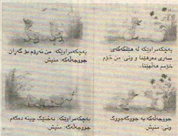
به چکه مرایک جووچه له که له مانا ناوکه دهره مانا جووچه له که منیش فریام بکوه... به چکه مرایک من جازیکی توش دهرم مهله دکهم جووچه له که به چکه چیک به لام - من نایم!