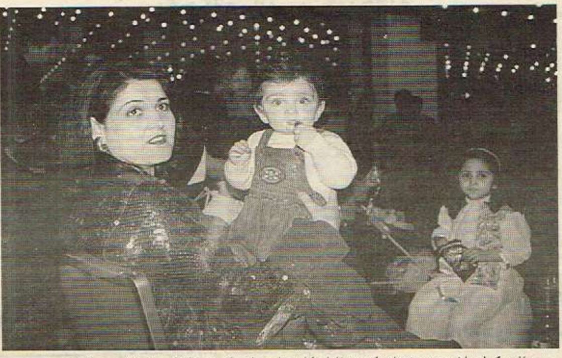
ناوریک له پاشه روژ: خیزانه کورده ناوارهکان چاوهروانی کوردستانیکه به ختوهه دهکمن...

تا ههنگی مه لهندهی روژنبری کورد، له لهندهن، نهروژی ۱۹۹۶، کامیاری ژینی نوی