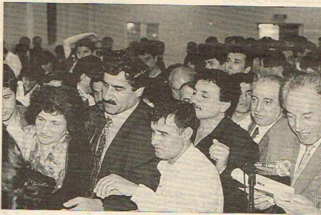
ئەندامانی مەلبەند کۆمیتەیی نوی هەلبژاردن - لەندەن کامیترای ژینی نوی

ئەو رووداوانی لە ناو مەلبەنددا روویان داوه پێش بەسەستی کۆنفرانسی، وەک نوێ کردنەوهی ئەندامەتی، وەرگرتنی ئەندامی نوێ، پارمەتی دانی هەموو کەسێک لەم بوارە دا زۆر دیموکراتی بوو: تا ئەو رۆژە کە تەرخان کرابوو، هەرکەس خواستیێتی بەشدارێ کۆنفرانسی بگات، رێی پێ دراوه. لە ئەنجامدا خەلکیکی زۆر بوونە ئەندام، گەرچی ناکۆ تەرا خەلکی بێلابەنیش ئەندامەتیان نوێ نەکردەوه، بەلام لێشاون ئەندامە نوێکان لە ئەندام و دۆستانی دوو حزبهکە (پێک و پێک) بوون خۆزگی خەلکی دیش بەشدارێ بکردیایە. پێم وایە ئەوەش دەبێتە قوناغتیکی دی لە دیموکراتییەت کە مەلبەند دەبێت خەباتی بۆ بگات. کارێکی نادیموکراتی نەکرۆوه بۆ دەستکاری ئەنجامی کۆنفرانسیەکە. لە ماوهی سێ سالی رابوردودا تەبابی