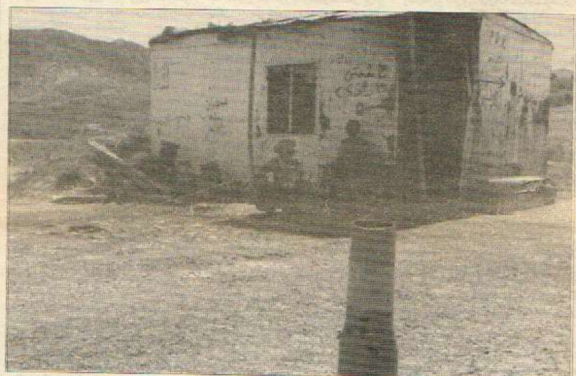
با ئاشتی و ئازادی لەترسی گوللە توپەکان تەنیا وشەیی سەردیوارەکان نەین کامێرای ژینی نووی - بەشوری کوردستان