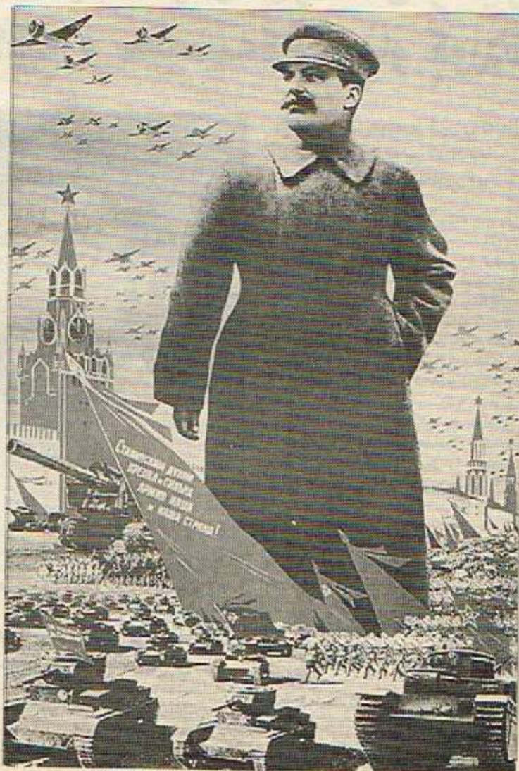
نابلوی لهشکرمان و ولاتمان لهکمال روجیهانی ستالیندا ۱۹۳۹، ف. دانی و ن. دوگرکوژوف

پوستر و فوژوی شار و خانووی ویزانه له لایهک، پوژرتیت و فیکهری مروقی تیکشکاو له لایهکی ترموه. هاور، تورمیون و دهسترواهشاندن له رووخساری هینلر، موزسولونی و ستالیندا زیندووویونهوه. له گۆشهیکی