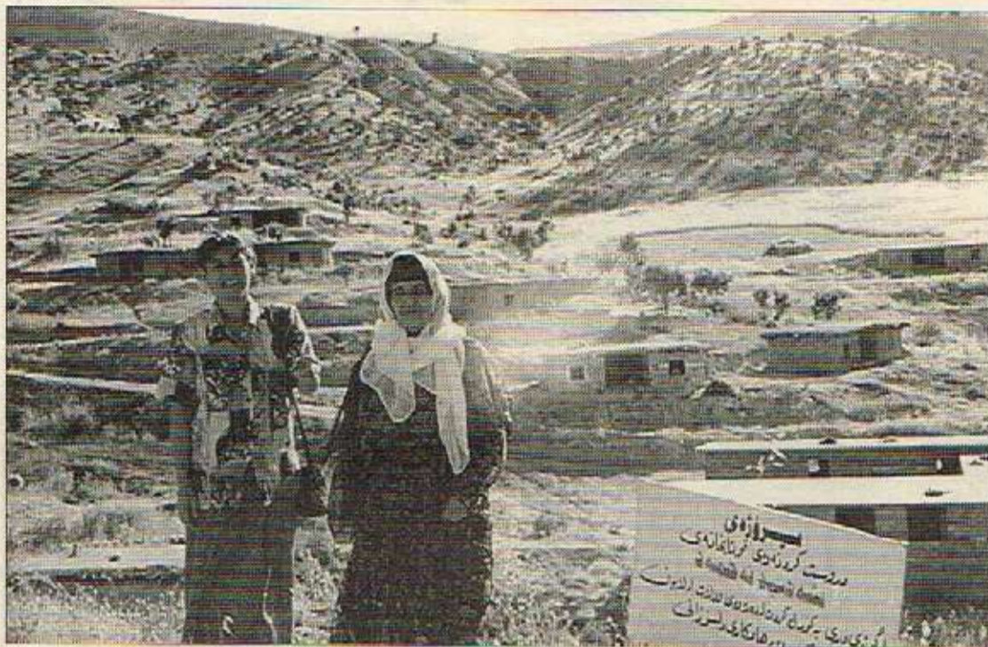
کامپێری باه‌که‌ر ده‌بین. باشووری کوردستان