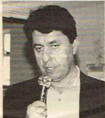
د. میران: ههلبژاردن بکرتته‌وه