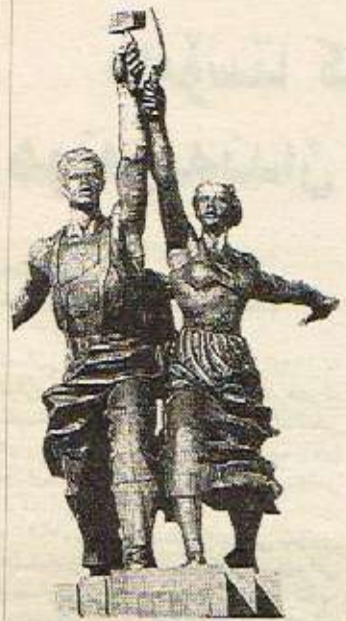
پهیکری داس و چهکوش بهدهست، سؤقیهت ۱۹۳۵، فیرهموغینه

رژیمیک نهوون و کاره هونهریهکانیان و مکو زهنگیک همیشه له گوچگی