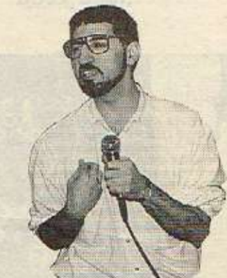
هوشیار عابـد: مهلبند ده‌ستکه‌وتی میله‌تی کورده، بۆیه ده‌بێت به‌رژه‌وه‌نی مهلبند بخه‌رتته سه‌رووی به‌رژه‌وه‌ندی ته‌سکی حیزبایه‌تییه‌وه. واش تـیـده‌گه‌م به‌رژه‌وه‌ندی نه‌وو حیزبانه له‌وه‌دا نییه که ده‌ست به‌سه‌ر مهلبندا بگرن.