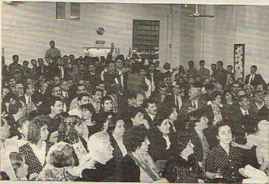
ئەندامانی مەلبەند لە کاتی لێدوانی کارەکانی کۆمیتەیی رابوردودا کامیترای ژینی نوی