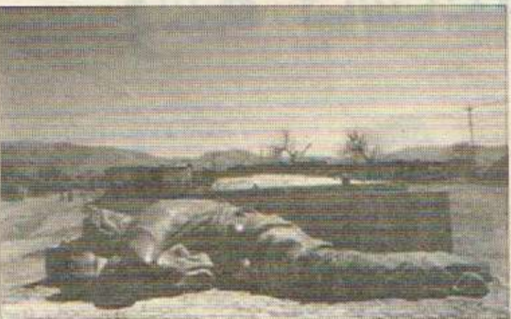
هەلەجەئێ شههید: باوئێشی باوکیش کۆریەکانی لە گازی بەعس رزگار نەکرد

بەلێ دەکرت. پیماننامەئێ سێفەر و بریاری ۶۸۸ وەک پیماننامە و بریارێک، لە راستیدا چارەسەرێ تەوا یان بۆ کیشەئێ کورد دانەنارە چونکە بریاری ۶۸۸ تەنیا رێزگرتنی مافی سۆزای لە سەرۆکی عێراقدا، جگە لەمانەش مەسەلەئێ کورد چەند جارێک بوو بە بابەتی چەند رێککەوتننامەئێک لە ئێوان ولاتانی دەرووبەری گەلی کورددا. ئەو رێککەوتننامەئێش گەرچی هەمسو لە دژ کورد بوون، بەلام بۆ خۆیان گەلی کورد مەبست بوو: لەوێدا و بەتەواوی لە دژی وی بوون. ئەوانەئێ بەرژوونەئێ گەلی کوردیان ئێدا بوو تەنیا سێفەر و بریاری ۶۸۸ بوون. سێفەر چەند لایەنی هەبوو، چارەسەرێکی ئێوانچال، بە چەند مەرجێکی سەختەو کە زۆر ئەستەم بوو جێبەجێ بکرتن. بریار، پیماننامە، کەئێ دێکیومنت و بەلگەنامە هەن لە یاسای ئێدوولەتاندا کە گەلی کوردیش دەکرتو: هێلەتان هەمسو بە یەکسان دەکرتو. هەلەت کار کورد ئۆرگانێکی دەستووری ئەبێت زۆر سەختە بێوانێت سوود لە یاسای ئێدوولەتان وەرگیرت: کیشەئێ بە پالیشتی رێککەوتننامەئێک، پیماننامەئێکی ئێدوولەتەوێی بەرێتە پێشەو. گەلی کورد لە رەوا ئێ کیشەئێکە پێدوولەتێت هەوێ بەت ئەو لایانەئێ کە دەکرتن بێن بە تیشک بۆ چارەسەرکردنی کیشەئێ کوردیان ئێ وەرگیرت. تا ئێمە خۆمان بێوانین رۆلمان هەبیت لە مەیدانی سیاسەتی جیهاندا.