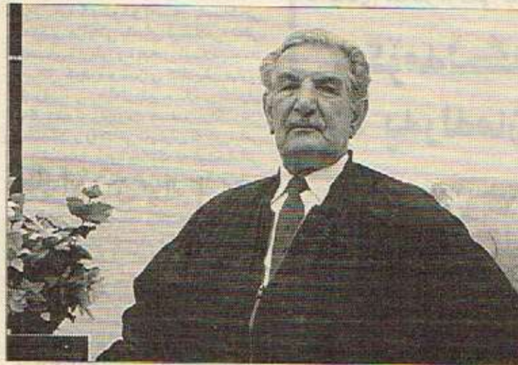
که‌ریم ئەحمەد سکرتیری یه‌که‌می حیزبی شیوعی کوردستانی عێراق

که‌ریم ئەحمەد سکرتیری یه‌که‌می حیزبی شیوعی کوردستان - عێراق و ئەندامی مه‌کتەبی سیاسی حیزبی شیوعی عێراق.