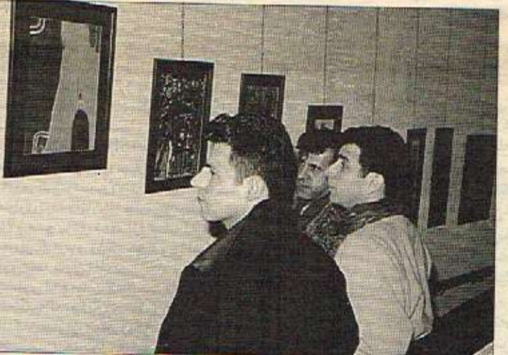
میوانەکان لە تابلۆکان دەروانن

پروژەیی داھاتوو پێشانگایێکی کە لە لایەن رێکخراو کۆمەڵگا کوردیەکانەوه دەیکەن. ھەر چەندە بۆ پروژەیی داھاتوو لەگەڵ بێنە کوردیەکان باسێکمان کردۆوه کە بتوانین ھەموو سالتیک جگە لە پێشانگای تاکە کەس. پێشانگاگەیی ھاوبەش بۆ ھونەرماندەکانی وڵات رێک بخەین. ھۆل و توانای ھونەرماندان لەو چوارچێشە داخراو دەریاز بیت و ئاسۆیەکی بەرفراوان تر باومەشیان بۆ بگرتەوه و خەلگانی ھەندەران ئاگادار بن لەوێ ھونەرماندانی کوردستان چ جۆرە شێوان، تەکنیک و پەیمانیکیان پێ دەکەن.