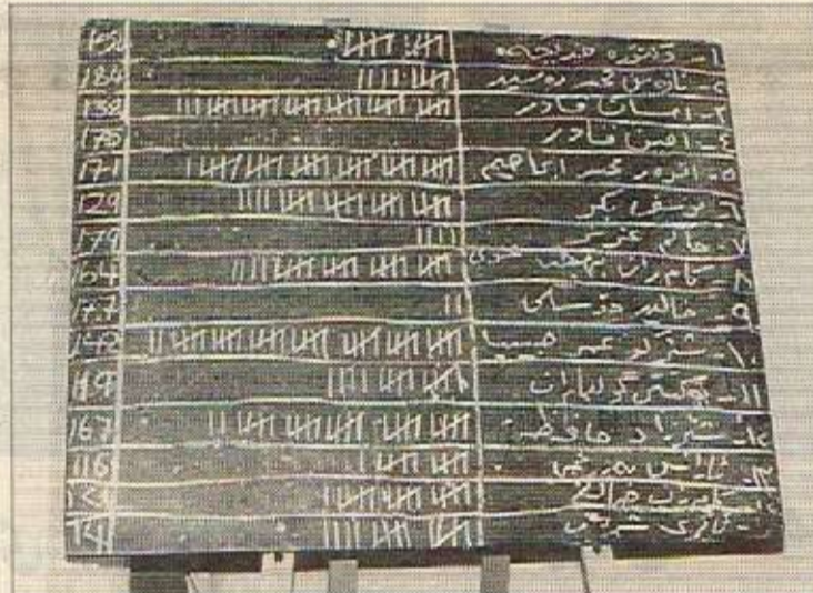
ناوی خۆه‌لبژێردراوان له به‌رامبه‌ر ژماره‌ی ده‌نگیاندا کامیترای ژینی نوی

کونجانه‌ی کۆمیتته‌ی پێشو بناغه‌کی دارش‌ت‌بوو بپارێژێ و به‌ هێزتری بکات. ۲- سه‌ره‌خۆیی مهلبند پته‌وتر بکات. کۆمیتته‌ی ههلبژێردراو بایه‌خی مهلبند هه‌ست پتی ده‌کات، هه‌ر‌یه‌ به‌و ئاقاره‌دا به‌رتوه‌ی ده‌بات که خه‌مه‌تی کۆمه‌لگای کوردی بکا له‌م وڵاته‌دا، جێ ی متمانه و برواری گشت لایه‌نه‌کان بێ، بێ جیاواری بیرووای سیاسی، فکری، ئایینی و ناوچه‌گری. ۳- مهلبند وه‌ک ئینستیتیوی کوردی ئەم وڵاته‌ زیاتر جیگی بروای ده‌زگا حکومه‌یه‌کان و ریکخراوه‌ چاره‌یه‌یه‌کان بێت. ۴- کۆمیتته په‌یوه‌ندیکی پته‌و له‌گه‌ل