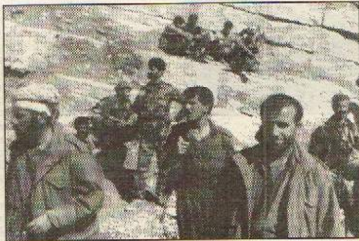
Peşmergeyên PDK tevî leşkerê Tirkîye di şerê PKK

Artêşa Tirkîye di roja 15ê Mey derbaz bûy gewretirîn hêrişê xwe di dema komara tirkî hatiye damezrandin bi 100 hezar serbaz kire ser serhildayên kurd e indamên PKK. Bi gotina Tirkîye PKK ji Başûra Kurdistanê êrişê dike ser bingehên serbazîye Tirkîye.