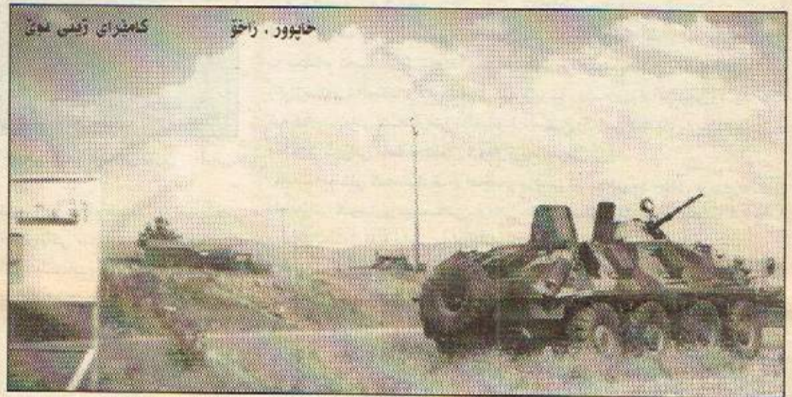
حایوور، راجو کاشترای ژینی نیو