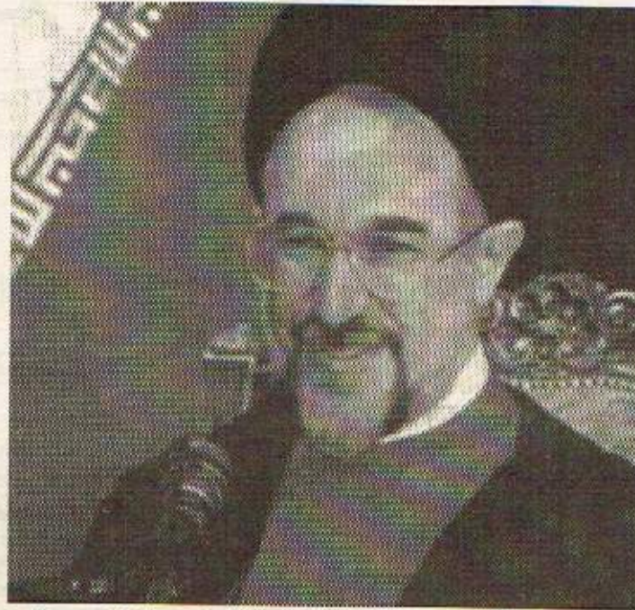
Xatemi le beranber taqîgay mêjûy gelanî Iran

Wilatanî Aurûpî, Amerîka û wilate erebîyekan le êstawe çiray sewziyan be Xatemi nişan dawê. Clinton le witarî xoyda le 28 Mey le diway kobûnewey serokanî Nato