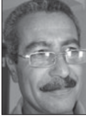
وشيار ئه حمهد ئه سوهد