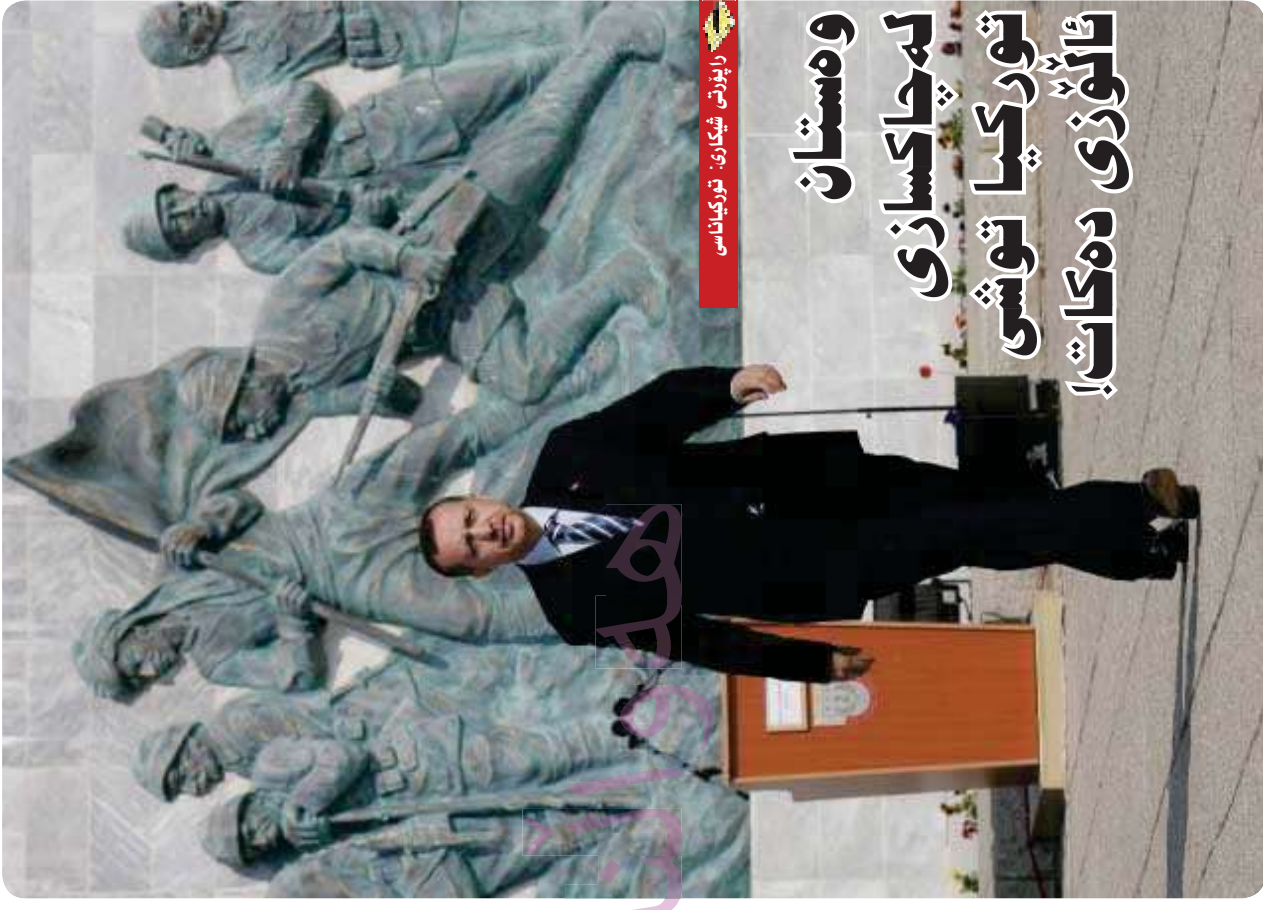
رايۇننى شىكارى: تۈركىيالىسى