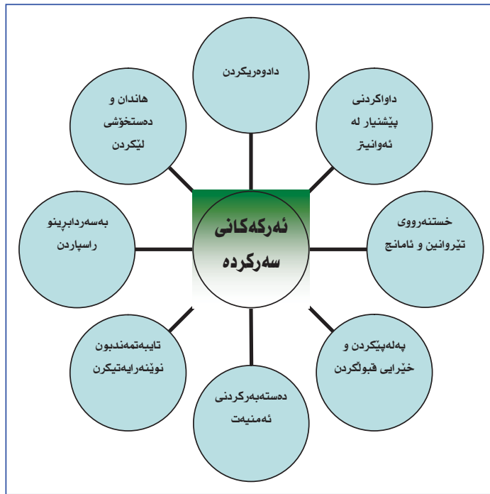
سهرچاوه: تکنلوژی و مهندسی فکر د. محمهد علی حه قیقی

- هاندان و نارهمومهنه نکرده دهکاته بنه مای چاککردنی نه ندامان، نه مهش له سهر نهو بنه مایه ((نهو رهفتاره ی پاداشتی له سهر وه ریکریت، نهو رهفتاره زیاتر ده بیته، نهو رهفتاره ش پاداشتی له سهر وه رنه گیریت یا لومه بکریت که مده بیته وه)).