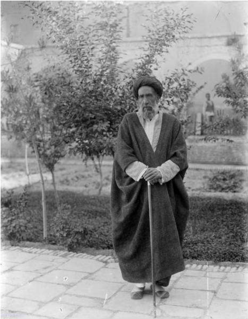
سید حسن مدرس