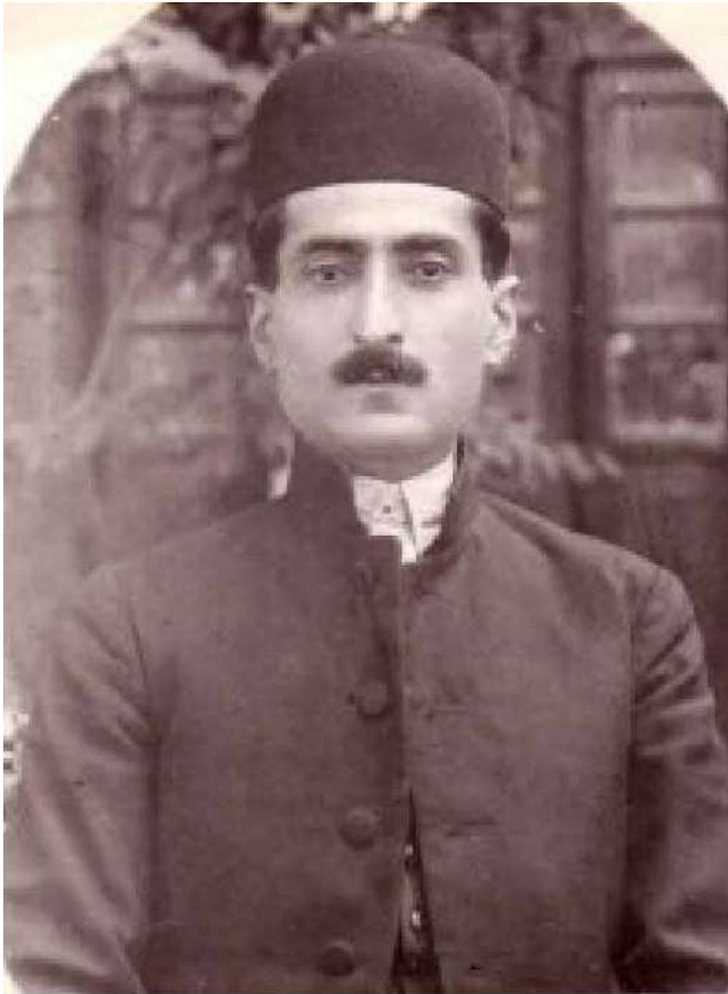
علیمردان خان بختیاری