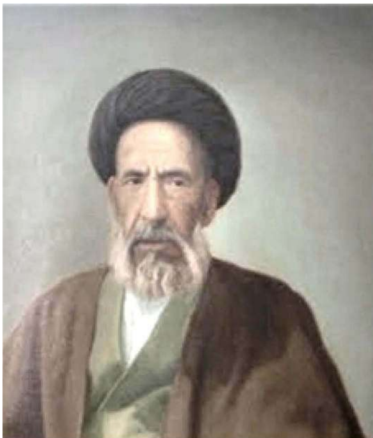
سید حسن مدرس