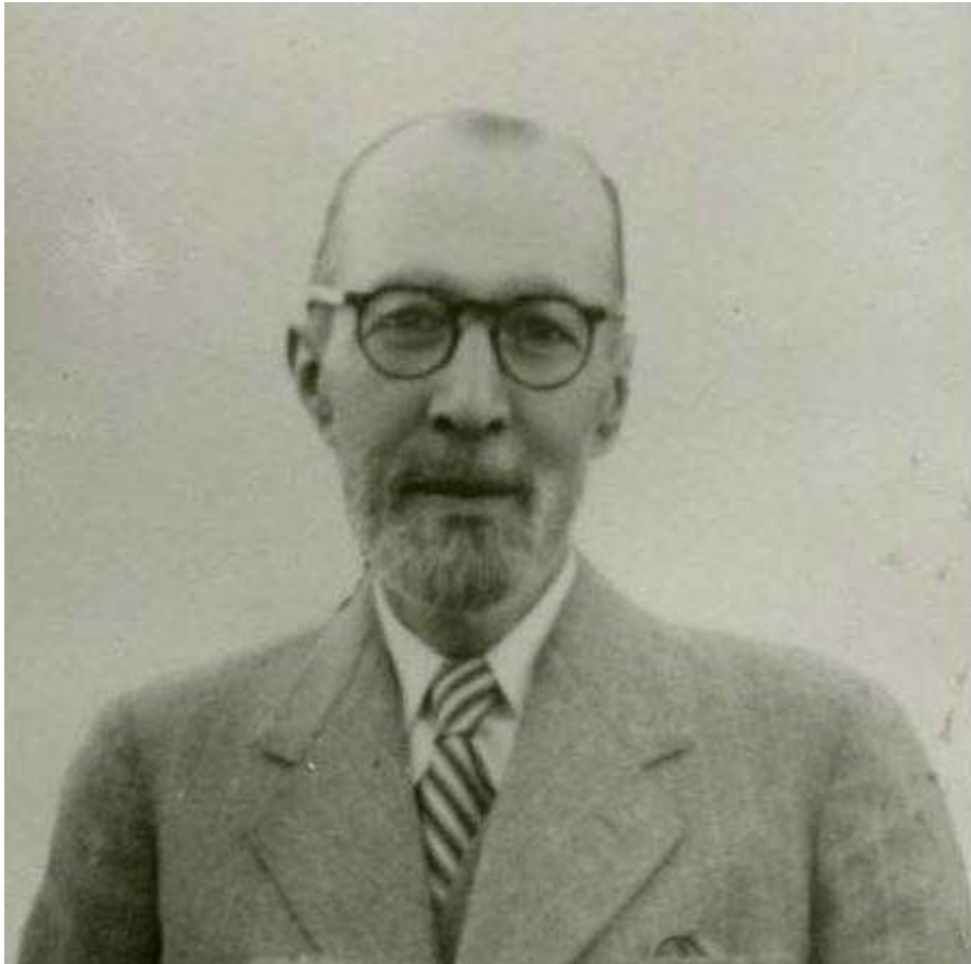
محمد تقی ملک الشعراء بهار