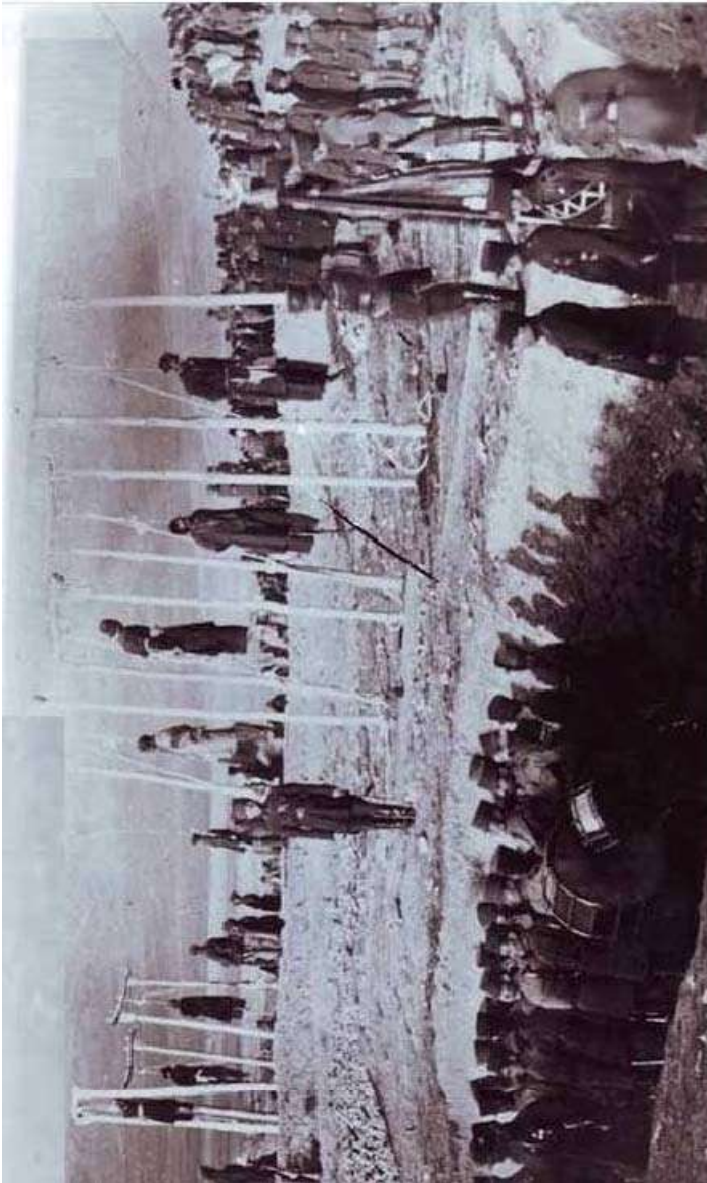
اعدام سران عشایر لر توسط قشون رضاشاه به فرماندهی سپهبد امیراحمدی ( قصاب لرستان)