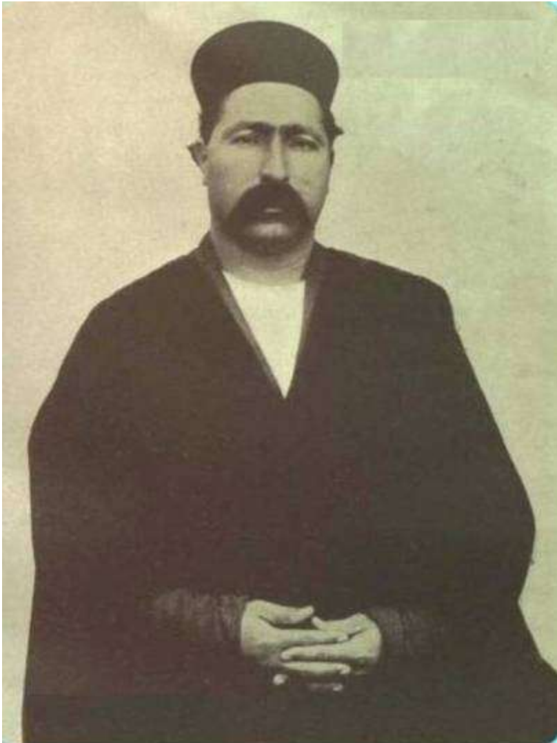
صورت‌الدوله قشقایی، سردار عشایر