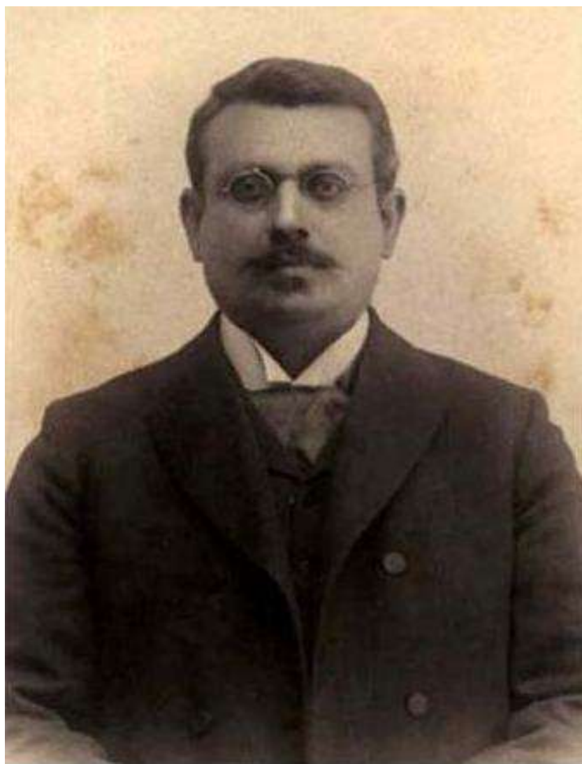
اردشیر ریپورتز (جی)