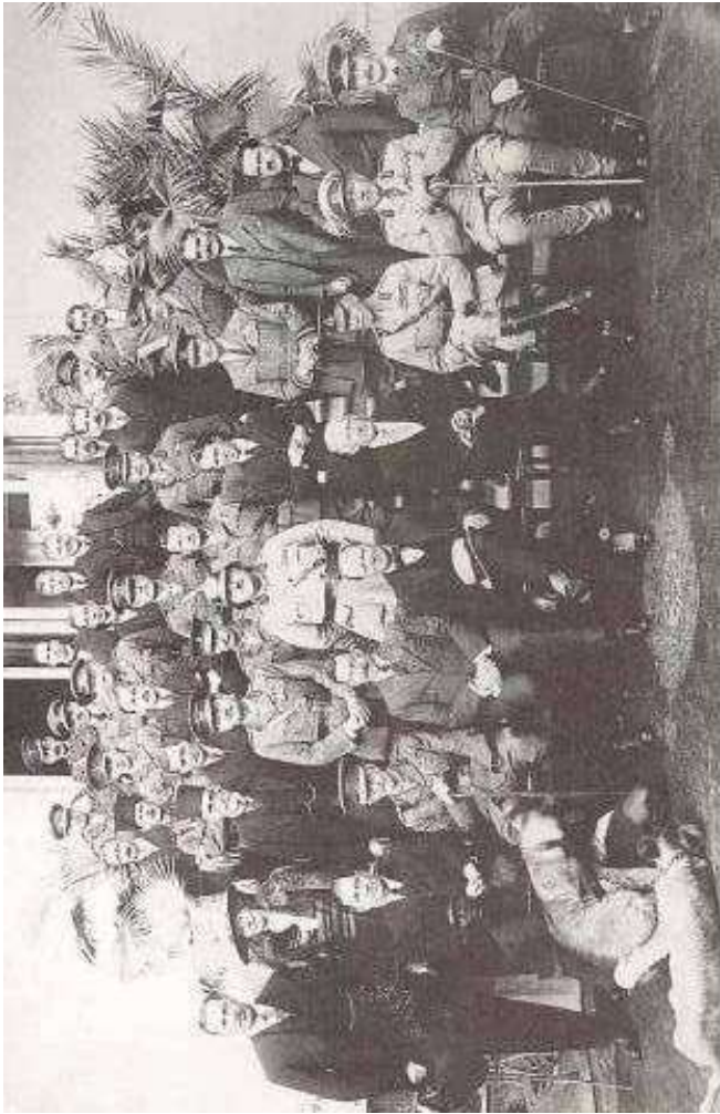
کنفرانس قاهره مارس ۱۹۲۱، بنشسته از چپ به راست: سرمالک استیونسن، ژنرال سروالتر کاتگرو، سر هربرت ساموئل، آقای وینستون چرچیل، سر پرسی کاکس، ژنرال هالین، ژنرال اسموند ایرونسلیک، ژنرال راد کلیف، ایستاده صف جلو از چپ به راست: سر جفری آرگر، خانم گرتروود بل، سامسون افندی، ژنرال سر اموارد تکین، سر هنک نورتن پشت سر کاکس، مارشال هوایی سر جفری سلموند، هربرت پاتگ