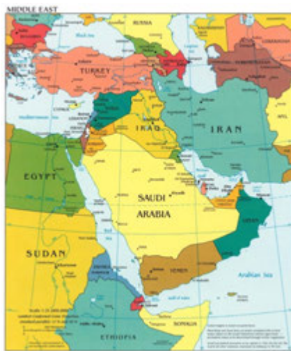
نەخشەى ۱-۱: رۆژھەلاتى ناوھەراست

بەرىتانيا دواى داگىركردنى ناوچەكە، عىراقى لە بەيەكەوھەلكاندنى سى وىلايەتى عوسمانى دروست كرد، كە وىلايەتەكانى بەغداد و بەسرە و موصل بوون. ھەرسى وىلايەت، لەو كاتەى لە ژىر دەسەلاتى عوسمانىيەكان بوون، ھەر يەك بە جيا لە دوو وىلايەتەكەى دىكە لە روى كارگىرپىيەو بەرپىو دەبران. پەيوەندى ھەر يەككىشىيان لەگەل بابى عالى لە ئەستەنبول راستەوخۇ لە رىگەى والى وىلايەتەكەو بوو. ھەرسى وىلايەتەكە لىكچوونيان زۆر كەم بوو، لە راستىدا جياوازيەكانيان زۆر زياتر بوون. پەيوەندىيەكانى بەسرە لەگەل دانىشتوانى كەنداو، بە بەرە عەرەبىيەكە و فارسىيەكەيەو، زۆر بەهيزتر بوو لە پەيوەندىيەكانى بە وىلايەتى بەغدادوھ (Walker 2003: 29-31). پەيوەندىيە عەرەبەكانى وىلايەتى موصل لەگەل عەرەبەكانى وىلايەتى سوورىا توكمەتر و توندوتولتر بوو لە پەيوەندىيەكانى لەگەل عەرەبەكانى وىلايەتەكانى بەغداد و بەسرە. بەگويرەى رۈونكردەوھەكانى مېژوونوسى بەناوبانگى فەلەستىنى-ئەمريكى ھەنا بەتاتوو ، تەنانەت لە سالانى يەكەمى دواى دامەزاندنى دەولەتى عىراقىش، عەرەبەكانى موصل لە روى دابونەرىت و سەروسىماوھ، زياتر لە عەرەبەكانى حەلب دەچوون لەوھى لە