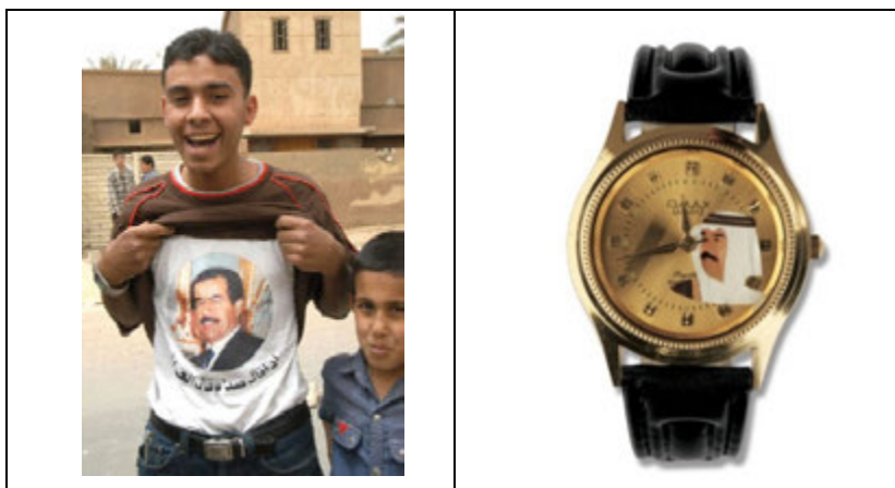
وینهى ۶-۱: وینه هه لکه ندرا و نه خشه ينراوه کانی سه دام ۲

"بالروح بالدم نفديک يا صدام"، واته "به رُوح و به گيان فيداتين ئهى سه دام". ۱ هزاران شيعر و گورانی و گوتار بۆ رېزليتان له "سه رکردهی بيهاوتا (قائد الفذ)" ههلبه ستران و گوتران و نووسران، که تيباندا سه دام وهک "تيکو شهر (المناضل)" و "سوارچاک (الفارس)" و "رؤژى عه ره ب(شمس العرب)" په سن دهکرا. دياره دهبيت ئاماژه به وه بکهين که ئه و کاريزمايهی له که سايه تيبی سه دام به دی دهکرا، خزمهت و ئاسانکاری به هه وه کانی دههوللیدهر و هوتافلیده رهکان دهکرد. بهس نا کریت ئه وهش له بېر بکهين که پرۆسهی پيرو زکردن و سه دام په رستی پشتی به بهرنامه یه کی سيسته ماتیکى سزادان و به خشينيش به ستبوو.