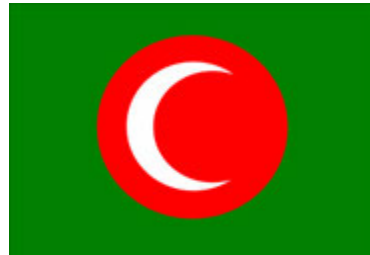
ويتهى ۲-۱: ئالاي حكومهتى شيخ مهحمود ويتهى ۲-۲: ئالاي شوپشى عه ره بى