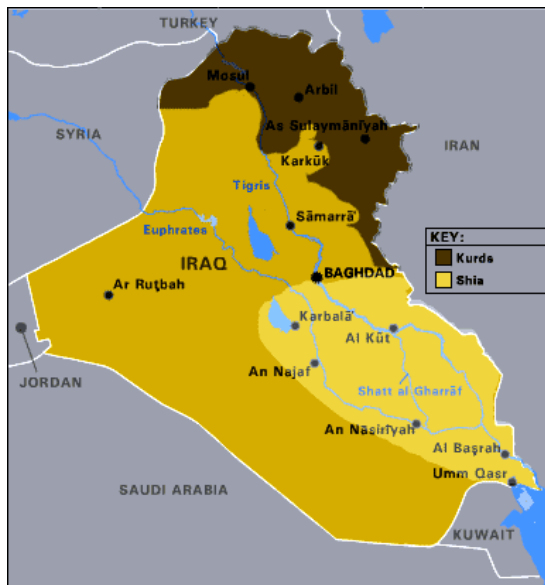
نه خشه ی ۱-۳: دیموگرافیای نه ته وه بی و مه زه هبی له عیراق

کورد دووه مین گه وره گروپی نه ته وه یین له عیراق، که نزیکه ی ۲۰% ی دانیش توانی عیراق پیک ده هینن و زۆر به یان موسلمان ی سونه مه زه هب و به شیک ی که میشیان شیعه مه زه هبن، کوردی کاکه بی و ئیزیدیش هه ن. کورده کان به گشتی له ناوچه شاخاوی و ته پۆلکاویبه کانی باکوور و باکووری پوژه لات ی عیراق نیشته جین (پروانه نه خشه ی ۱-۳). تورکمانه کان سنیه م گروپی نه ته وه یین که له چه ندین ناوچه ی جیا جیا ده ژین، له وانه شاره کانی که رکوک، هه ولێر، ئالتوونکو پری، تازه خورماتوو و ته له عفر.