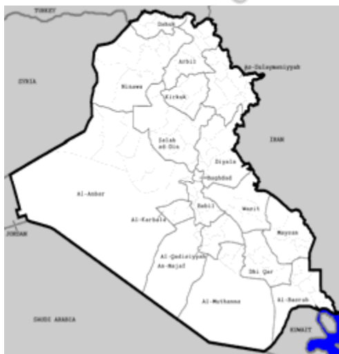
نەخشە ی ۱-۲: عێراق

قادسییه (دیوانییه)، نه جەف، کەربەلا، بابل (حللە)، واست (کووت)، بەغداد، ئەنبار (ڕومادی)، سەلاحەدین (تکریت)، دیالە (باقووبە)، نەینەوا (موسڵ)، کەرکوک، هەولێر، سلیمانی و دھۆکن (بروانە نەخشە ی ۱-۲). ۱ لە کاتی کدا ئەم دابەشکردنە لە زۆر ڕووی کارگێڕییە وە ئیستاش کارایە، کەچی سێ پارێزگا لە کوردستان، سلیمانی و هەولێر و دھۆک، لە گەڵ چەند قەزا و ناحیە یەکی پارێزگا کانی کەرکوک و دیالە و موسڵ، هەریمی دانپینراوی کوردستان پێک دینن. جیگە ی ئاماژە یە کە سنووری هەریمی کوردستان نە سنووری میژووی-جوگرافی- نە تەوہیی کوردستان، نە سنووری ناوچە ئۆتۆنۆمیە کە ی سەردەمی بە عسە (۱۹۷۴-۱۹۹۱)، بە لکو سنووریکی نوێ یە کە دوا ی کشانە وە ی هێزە سەربازیە کان و دەزگا کارگێڕییە کانی حکومە تی عێراق لە ساڵی ۱۹۹۱ دروست بوو. دەستووری ساڵی ۲۰۰۵ ی عێراق یش تەنیا ئە و ناوچانە ی کە لە بەرواری ۲۰۰۳/۴/۹، ڕۆژی ڕوو خانی ڕژیمە کە ی سەدام حسین، بە شیک بوون لە هەریم، بە فەرمی وە ک هەریمی کوردستان ناساندو وە.