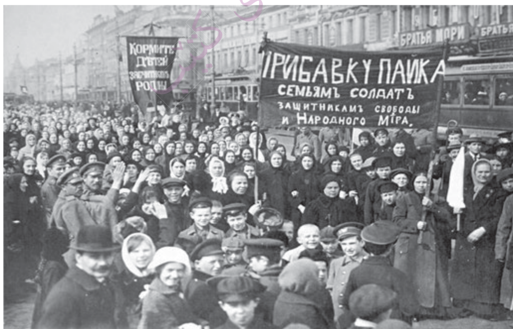
Приложение 6. Демонстрация работниц Путиловского завода в первый день Февральской революции.