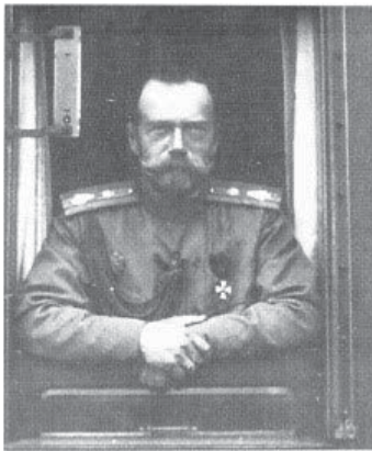
Акт об отречении Императора Николая II. 2 марта 1917 г.