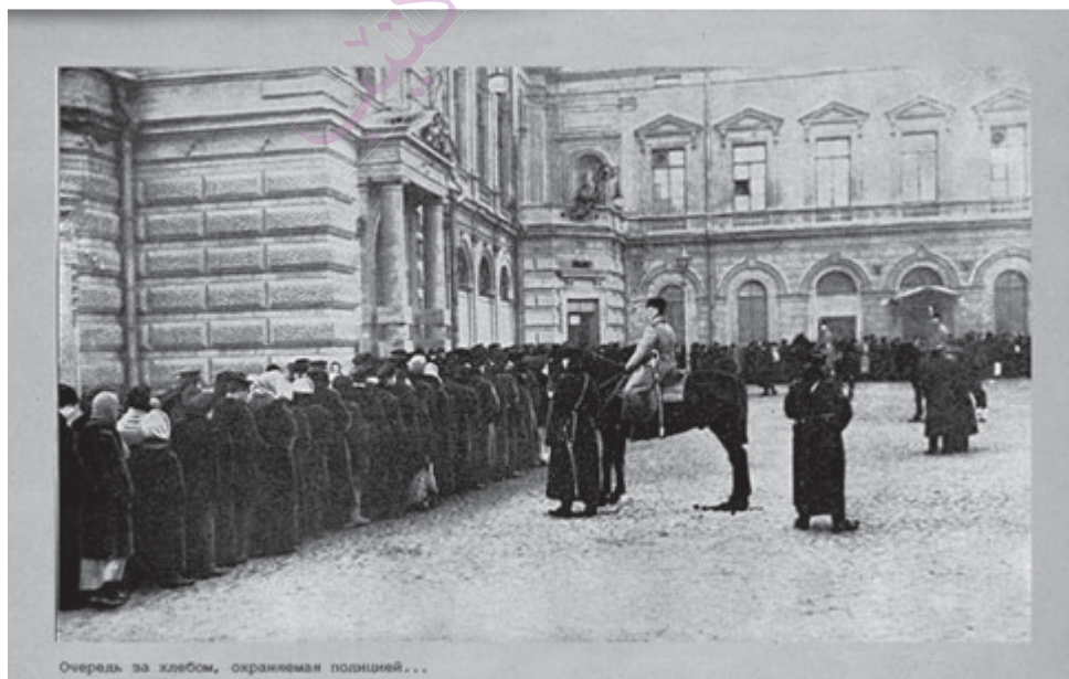
Приложение 2. Очередь за хлебом, охраняемая полицией.