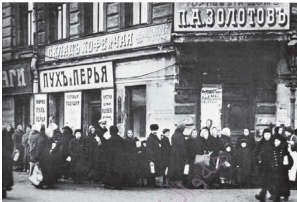
Приложение 1. Январские очереди за хлебом.