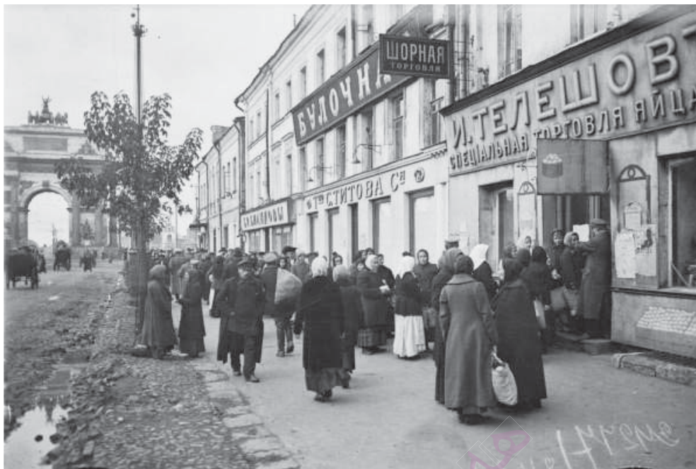
Приложение 5. Очередь за продуктами на Тверской-Ямской.