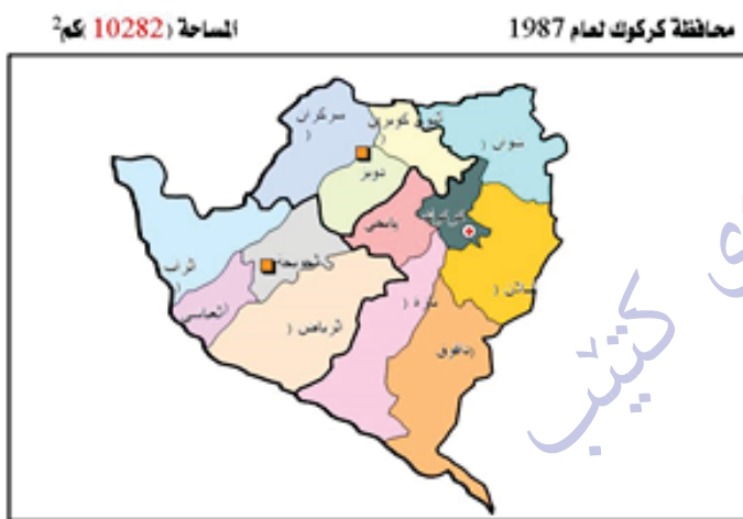
نه خشه ی ژماره ۳ کرکوک ۱۹۸۷