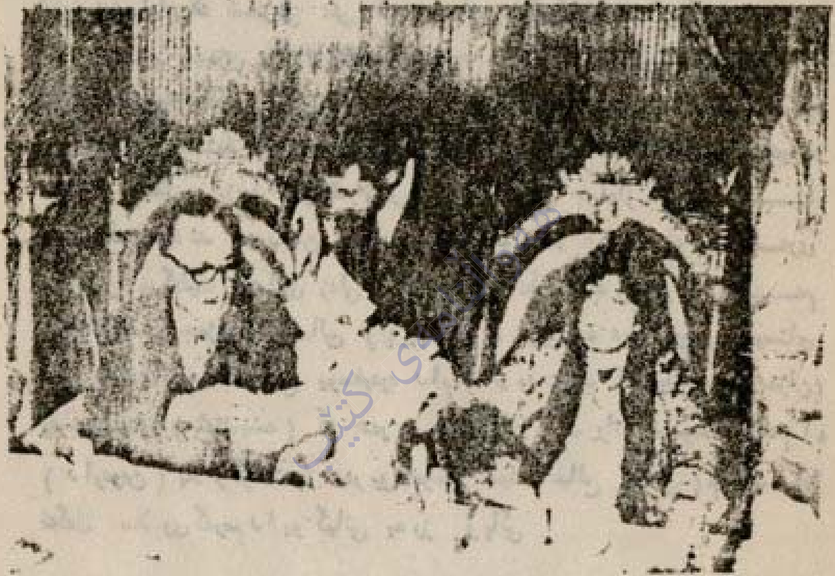
سه کمال سعید صالح یوسفی را

تاملات و تاملات ( تاملات و تاملات ) تاملات و تاملات ( تاملات و تاملات ) تاملات و تاملات ( تاملات و تاملات ) تاملات و تاملات ( تاملات و تاملات )